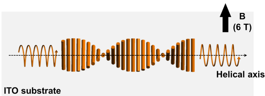
図3 磁気ドメイン様ヘリカルストライプの概念図。配向した擬ドメイン構造を持つヘリカルスピリマーである。ITO: Indium-tin-oxide coated glass.